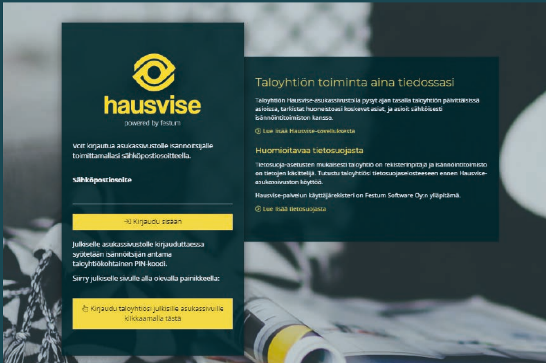
Hausvisen asukasportaalin kirjautumissivu.

Palveluun voit kirjautua sähköpostiosoitteellasi, jonka olet antanut isännöitsijällesi. Voit kirjautua palveluun tietokoneella, älypuhelimella tai tabletilla. Kirjautumissivu näyttää seuraavalta: